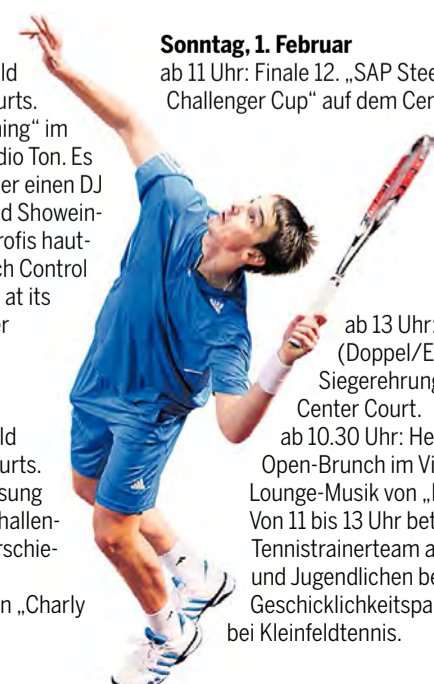
ab 13 Uhr: Finale (Doppel/Einzel) und Siegerehrung auf dem Center Court. ab 10.30 Uhr: Heilbronn-Open-Brunch im Village mit Lounge-Musik von „In2Deep“. Von 11 bis 13 Uhr betreut ein Tennistrainer-Team alle Kinder und Jugendlichen beim Geschicklichkeitsparcours und bei Kleinfeldtennis.

Sonntag, 1. Februar ab 11 Uhr: Finale 12. „SAP Steeb Junior Challenger Cup“ auf dem Center Court.