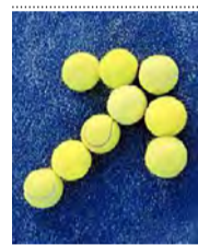
Heilbronn Open 25. 1. – 1. 2. 09

INTERNET Moderner, farbiger, auffälliger: Nach vielen Jahren präsentieren sich die Heilbronn Open vor allem im Internet ( www.heilbronn-open.de ) mit einem neuen Gesicht. Im Mittelpunkt des neuen Designs steht das plakatative Erkennungszeichen mit dem dynamisch nach oben gerichteten Pfeil aus Tennisbällen. Es symbolisiert das Motto des Turniers: Mit uns an die Spitze. Auf der noch übersichtlicheren Website gibt es alle Informationen zum Turnier, unter anderem die Webcam und die Live-Scoring-Anwendung wurden verbessert. Im